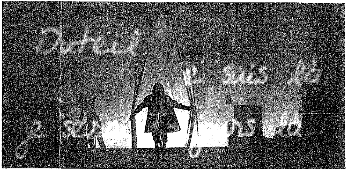
Les images vidéo jouent un puissant rôle d'évocation