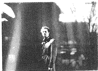
Vaterland : Le Pays du père

Création du CDN de Thionville-Lorraine d'après le récit de Jean-Paul Wenzel.