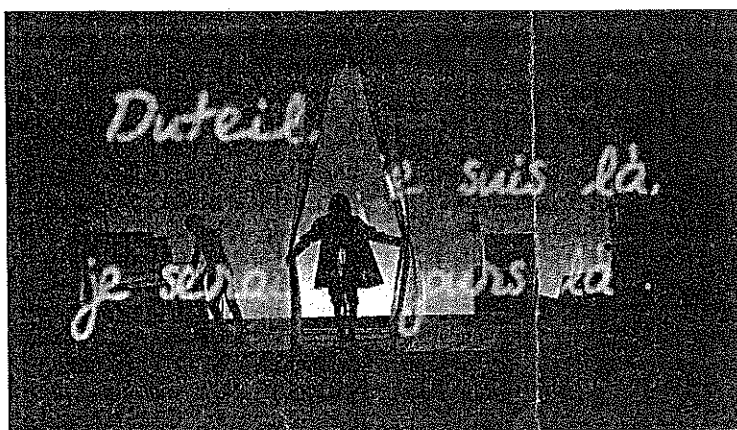
Une atmosphère théâtrale aux échos sensibles et rationnels.

Etonnant puzzle que celui de «Vaterland», un récit, une pièce en brèves séquences entrelacées: 1982, Jean Duteil, un musicien, effectue une tournée de concerts en Allemagne, une Allemagne encore divisée. En fait, c'est une tournée prétexte: il est à la recherche de son père, un soldat allemand dont on a perdu la trace à la fin de la guerre, et dont sa mère, si longtemps après, vient enfin de lui révéler la réalité. 1943, ce soldat allemand caserné à Saint-Etienne, après l'avoir assassiné, se fait passer pour Louis Duteil, et épouse Odette Garnier. 1945, Henri Duteil part à la recherche de son frère, à Saint-Etienne d'abord où il découvre la substitution d'identité opérée par ce soldat allemand qu'il va tenter de retrouver dans l'Allemagne en ruines d'alors. Où est ce soldat, qu'est-il devenu? Une